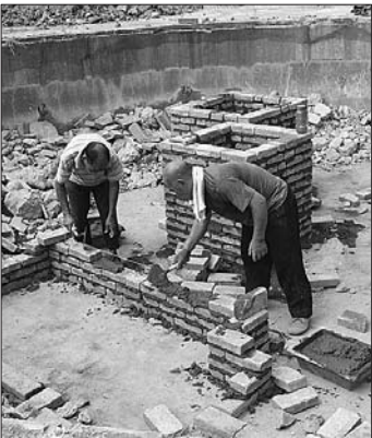
现场正在砌墙的工人。

园林局工程管理科工作人员介绍,他们是6月12日开始施工的,预计8月底完工,最近经常下雨拖延了工期,应该会延缓半个月完工。截至目前,已基本完成北区荷兰砖的铺装、路沿石安装及入口处台阶石安装,累计完成投资50余万元。