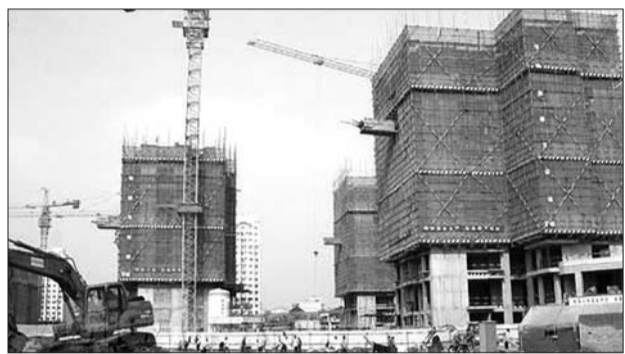
我省出台房地产新政策意在消化商品房库存。