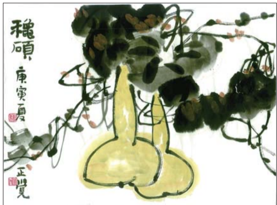
山大路社区 李涛作品