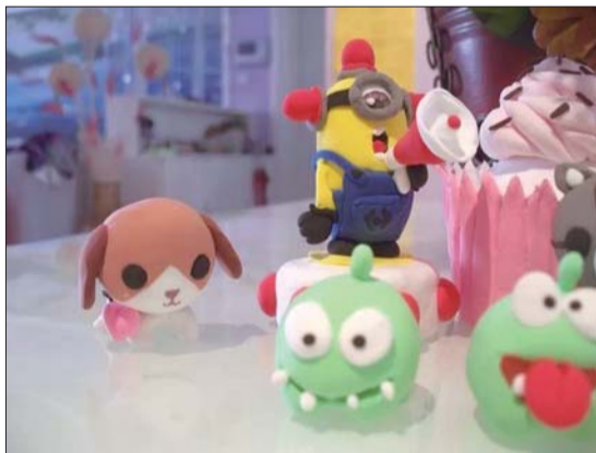
山师东路社区 佳佳小朋友作品