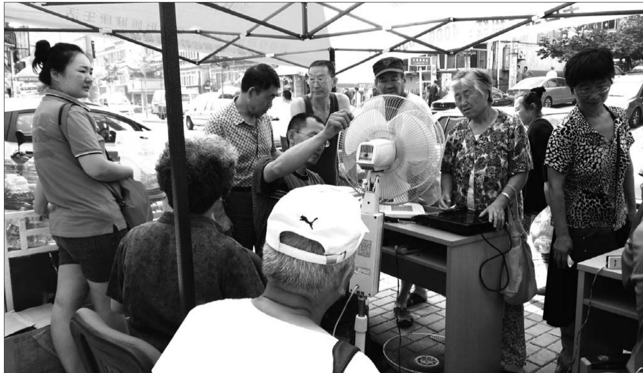
16日的活动现场,不少居民在排队等候维修家电。

记者注意到,今天维修电风扇的特别多。家住锦绣新城的翟女士特地赶过来维修电风扇,之前社区帮办去锦绣新城时,翟女士并不知道,事后看报纸才知道自己错过了。翟女士这次带着金龙牌的老风扇找于