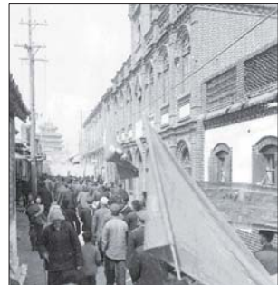
解放后拍摄的“中华书局东昌分局”。

在近年出版的一本摄影集中，有一幅标明“中华书局东昌分局”的老照片，古城老居民说它是古城新书业的标志、较早的仿西式建筑、民国年间罕见的二层楼房，赞美之情溢于言表。