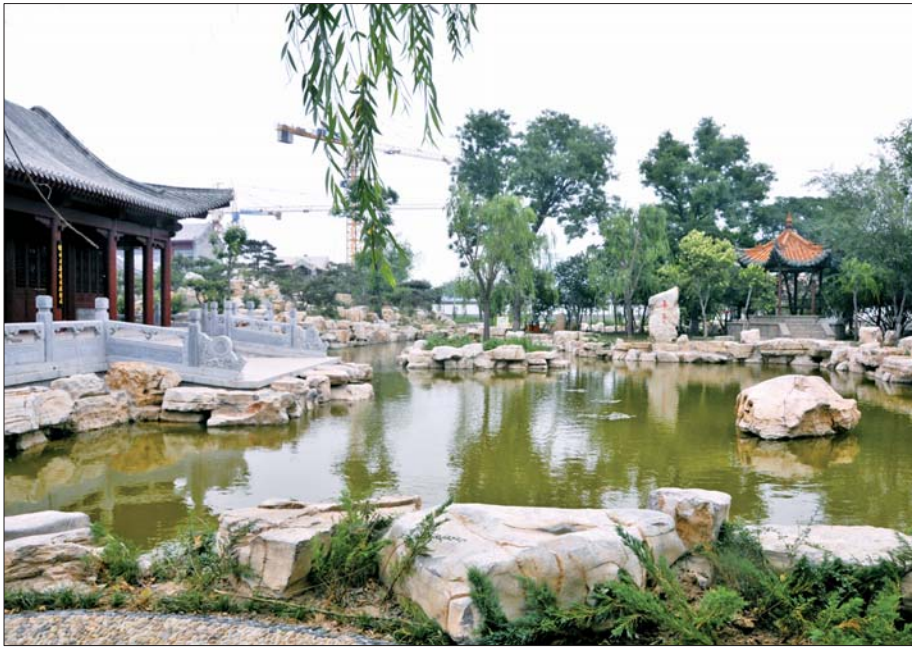
复建后的任家花园——绮园景色优美。