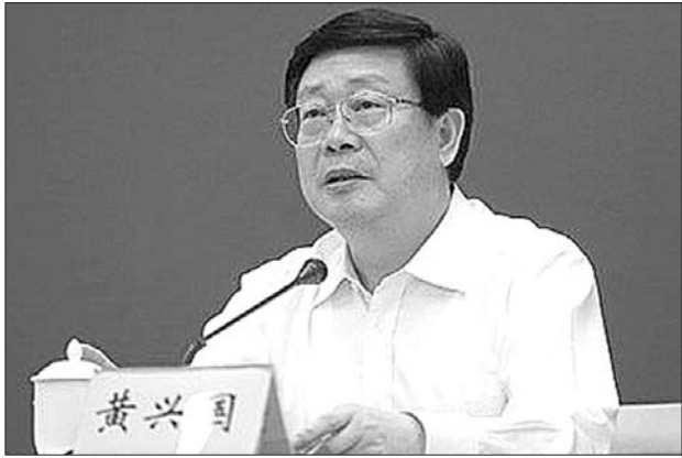
黄兴国出席天津港“8·12”爆炸事故第十场新闻发布会。 据天津政法综治门户网站

发布会上黄兴国说,将追认牺牲的消防人员为烈士,就高的标准和高的原则发给褒扬金和抚恤金。将建议在事故现场建一个公园,让人们永远怀念他们。