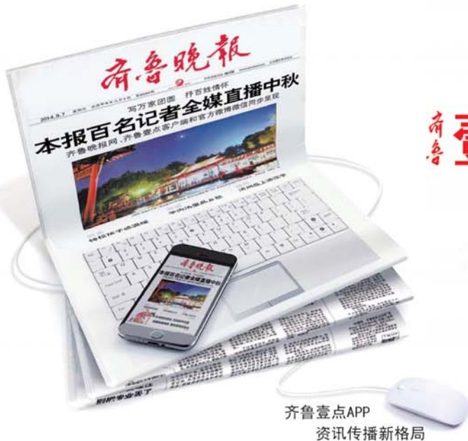
齐鲁壹点APP 资讯传播新格局

青岛客运段烟台车队四组全体乘务员在暑运中坚持全心全意为旅客服务,帮助旅客解决实际困难。图为帮助重病旅客乘车。(毕凯)