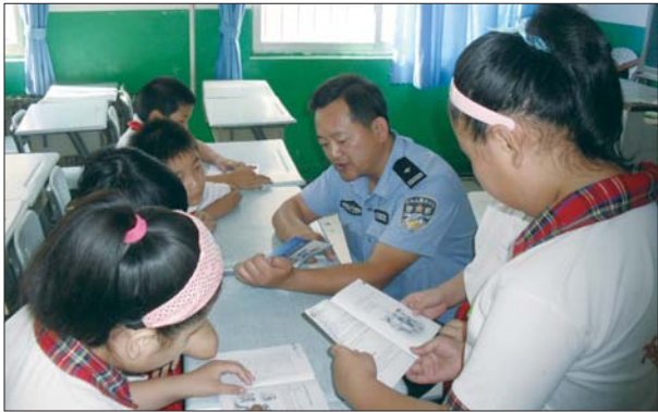
派出所民警进校园给孩子讲安全知识。(资料片)

管理处罚法等法律之中。这些法律并没有明确划分政府、相关职能部门、学校、师生在校园安全管理中的权利义务,对学校人身伤害事故处理缺乏可操作的法律依据,又存在空白;其次是对校园安全管理不够重视,个别地方和学校在思想认识、责任措施、管理监督、安全保障等方面还有不到位的情况,存在较大隐患;同时,校园周边环境秩序不容乐观。 淄博市人大教科文卫委认为,淄博在校园安全管理方面存在的上述问题原因是多方面的,但是制度不健全是一个重要原因,校园安全立法有助于构建学校安全管理制度和安全保卫体系。