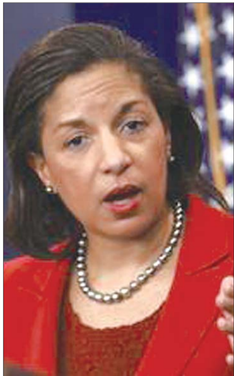
美国总统国家安全事务助理苏珊·赖斯 (资料片)

8月25日,中美两国同时宣布,美国总统国家安全事务助理苏珊·赖斯将于8月28日至29日访华,为习近平主席今年9月应奥巴马总统邀请对美国进行国事访问作准备。值得注意的是,赖斯此访正值美国国内要求美国政府收回对中方邀请的声音甚嚣尘上之际,赖斯此访无疑表明了美国方面的态度。