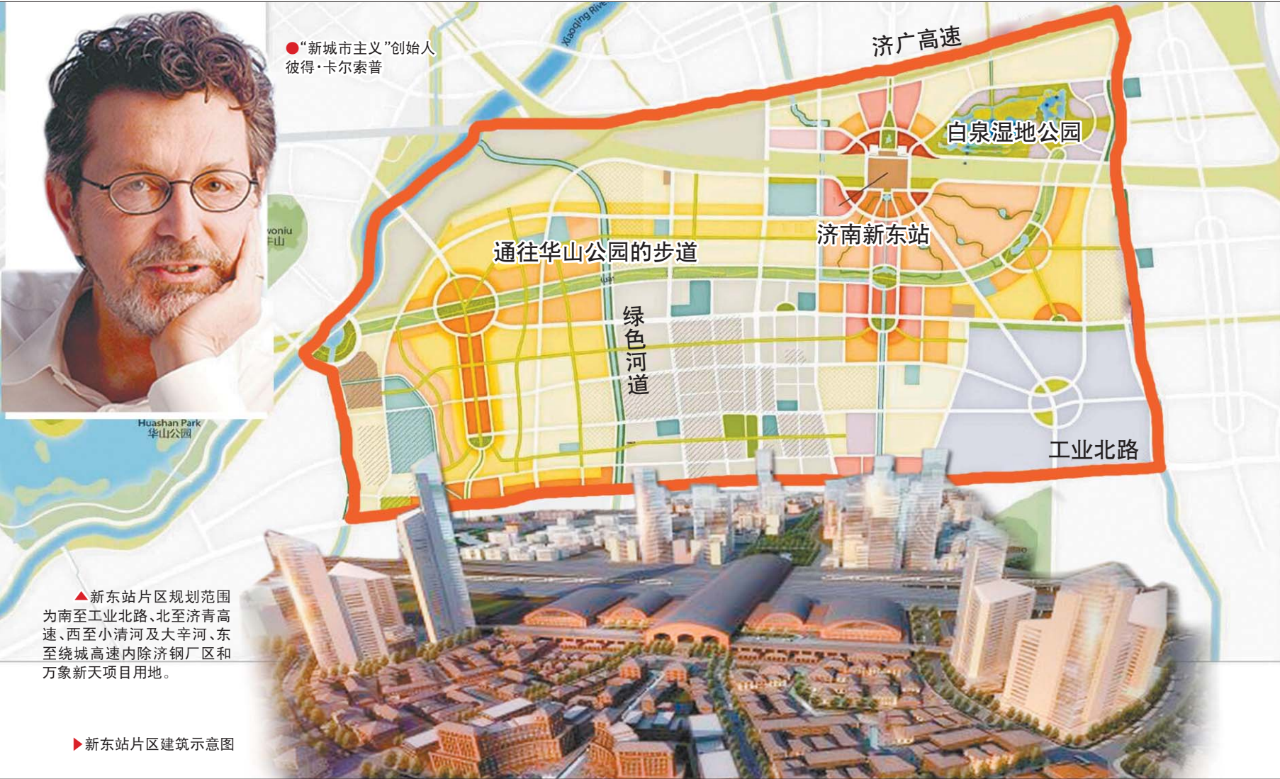
▲新东站片区规划范围为南至工业北路、北至济青高速、西至小清河及大辛河、东至绕城高速内除济钢厂区及万象新天项目用地。

“更好的公共交通系统和完善的便利的行人和自行车网络将允许密集的开发而不会造成交通瘫痪。”该负责人说，交通拥堵问题往住是中国其他高开发强度项目的挑战。来到片区和片区内部的人们将能够通过步行、骑自行车或公交出行，避免对汽车的依赖。维持片区工作和住房平衡也有助于减少人们的长途通勤量，从而减少交通拥挤，部分