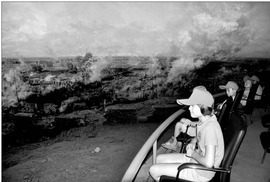
孩子们参观冀鲁豫纪念馆。

今年13岁的刘正立家住牡丹区马岭岗镇,现在与哥哥相依为命,“每当看到别人有爹有娘,心里就很难过,多亏了民政部门给我办理了孤儿补助金,