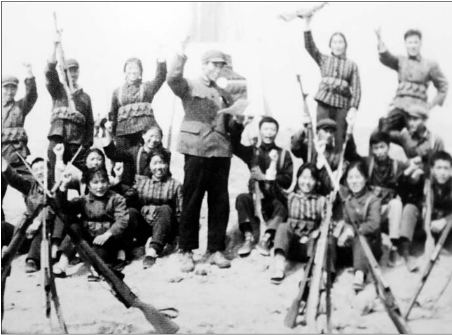
革命年代里，保家卫国的西顿邱民兵。