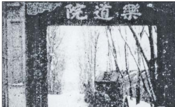
乐道院正门。(资料片)