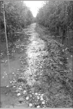
▲冬枣园里,大量冬枣漂在水里。