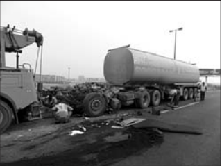
29日早晨6时许,事故处理人员正在拆解车辆。