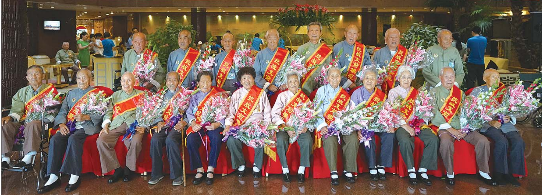
3日下午,参加完阅兵仪式,来自我省的支前模范合影。