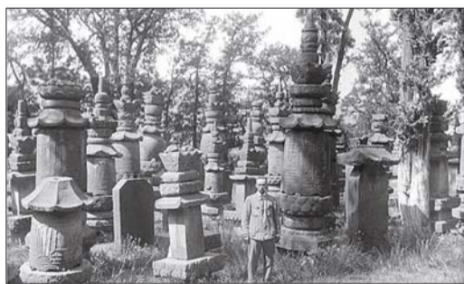
杂草遍地的墓塔林。中间的站立者是法国汉学家沙畹。