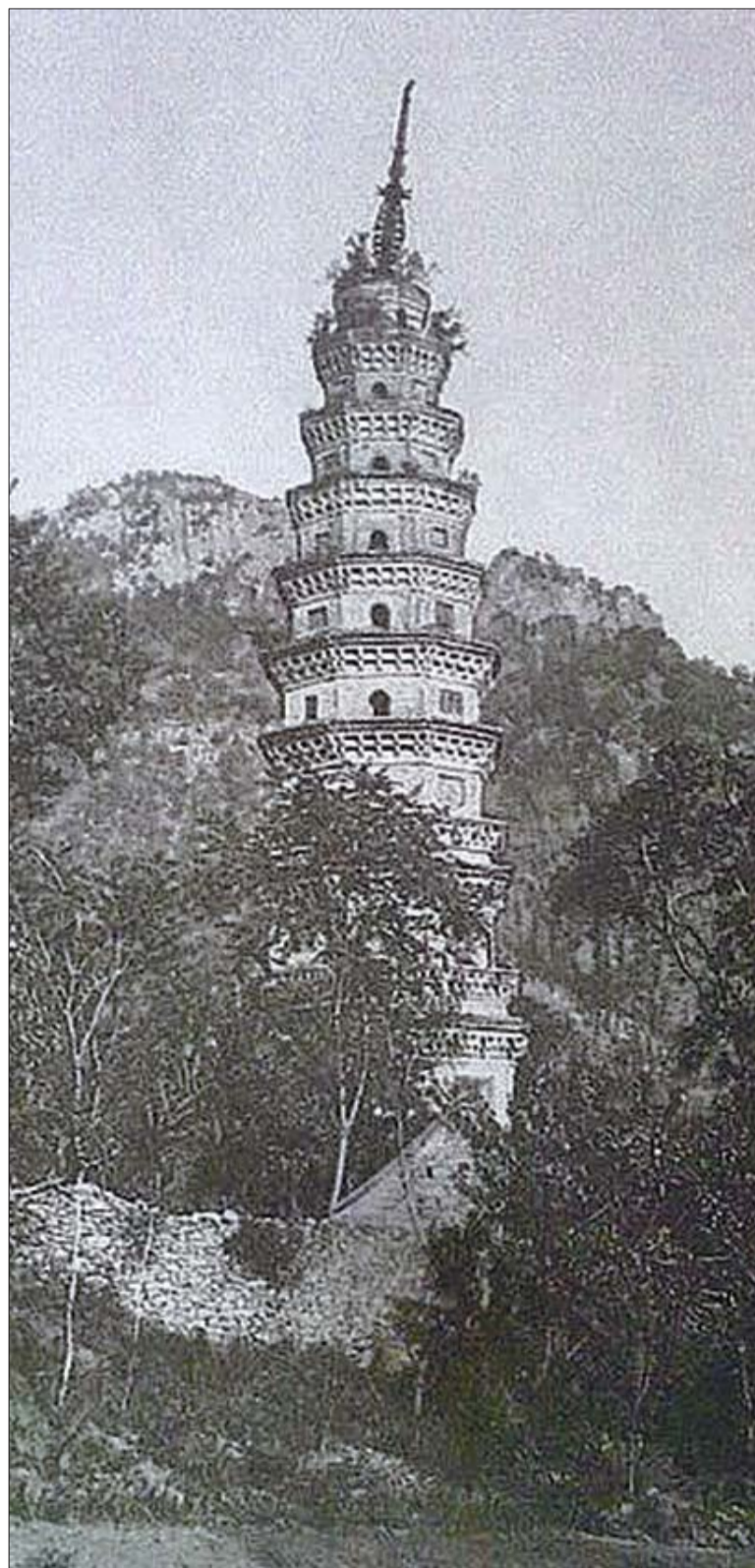
辟支塔的塔刹已倾斜,塔顶杂草灌木丛生。