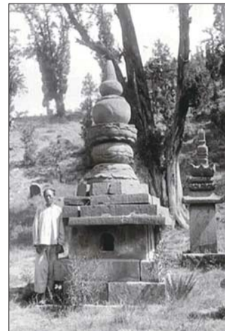
▼当地的百姓在一墓塔旁。