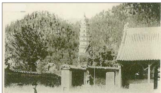
1910年左右,在日本发行的灵岩寺明信片,所反映的景致和现在变化不大。

今天我们翻看一百多年前灵岩寺的老照片,不得不让人感叹时空的不停转换,社会的飞速进步,世间的沧桑巨变了。