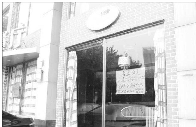
房屋租赁信息已经张贴了出来。

本报济宁9月22日讯(记者 高雯) 日前,经营十年的“伦巴萨意式餐厅”广场店,悄然关门歇业。近一两年,迪欧咖啡两家店相继关门,欧克咖啡也关门一家……消费群体的萎缩、商圈迭起后竞争的加大,让城区经营十年左右的老牌咖啡西餐厅频频关门或“瘦身”。 21日上午,记者来到位于新世纪广场西侧的伦巴萨意式餐厅,恢宏的砖红色装潢,三层意欧风情小楼,还透露着曾经的气派。紧闭的大门上,张贴着关门公告和一张转租信息,透过玻璃窗向里望去,部分桌椅已搬空,地上散落着托盘、杂物…… 伦巴萨意式餐厅一负责人告诉记者,餐厅广场总店已持续亏损一两年。一层、三层一直没营业,只有二层还承接西餐。“从2011年开始,西餐业务量开始下滑,这边也做过很多改变,改过西式自助餐,后来还把一层改成火锅做了一年,但效果都不理想。”该负责人说,关门前几个月,每