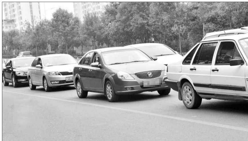
振兴路向阳路路口,等红绿灯的车很多都开着车窗。

22日,东昌路柳园路路口,记者发现,等红绿灯的车中,10辆有8辆是开着车窗的。很多一个人在车上的车主,都喜欢把包和随手用的东西放在副驾驶座上。“这个季节不冷不热,我开车出门都是开着车窗的,不然车里很闷,开空调又有点冷。所以开着车窗既通风又环保。”车主刘女士说,听说有人专对这种司机下手,“那都是网上传的,我觉得聊城应该没有。”很多车主很大意,觉得可能不会发生在自己身上。“一般都是春秋季节喜欢开着车窗,冬天冷,夏天热多数车主都开空调,只有春秋不冷不热