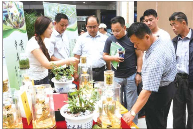
本届林交会引来了众多客商参会。

同时,本届林交会通过媒体宣传、各级林业部门组织、参展企业邀请、专业市场的登门推介,突出了对采购商的邀请,采购商人数达到了历届最高。