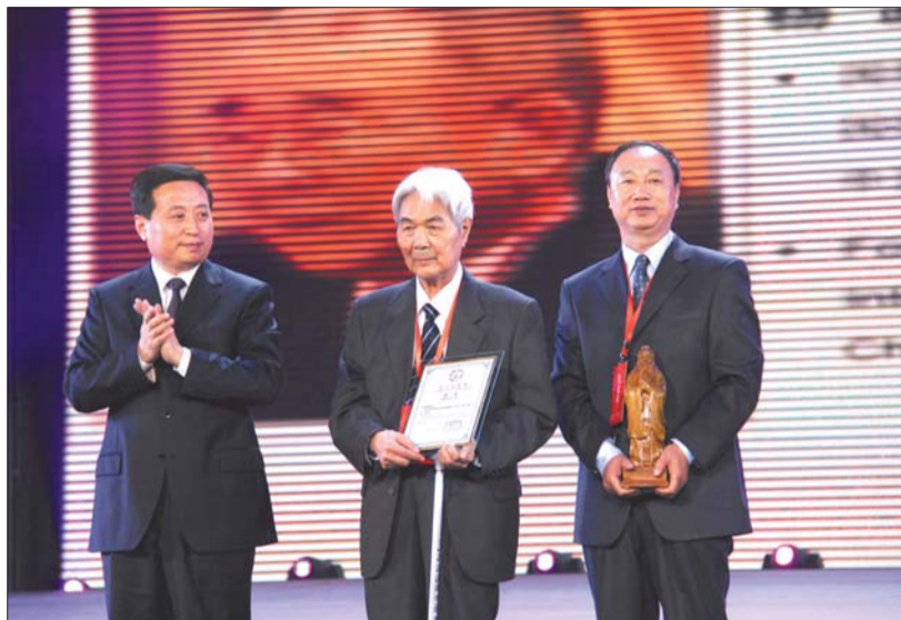
2010年孔子文化奖颁奖场景(资料图)。

今年的儒学大会不仅保持了一贯的学术含量，同时也做出了多个创新。邀请40名青年博士参会，并举办首届青年博士儒学论坛；150余位专家学者中秋夜将赏月、话儒学。