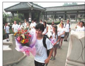
奥地利学生在孔子研究院参加修学夏令营(资料图)。

今年的儒学大会与往年不同，期间恰逢仲秋节。“孔子研究院院长杨朝明说，中秋月圆之夜，与会的150余位专家学者将共同在孔子研究院内共同赏月、话儒学。“可以想象，大家品茶赏月、共同话儒学将是何种雅致和谐的场景。”杨朝明笑着说。