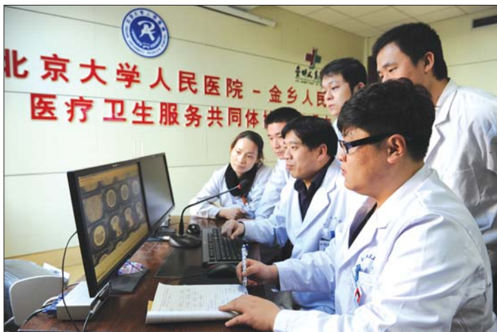
医疗服务共同体远程医疗。

近年来,在上级卫生计生主管部门的关心支持下,医院从不断满足广大人民群众日益增长的医疗保健需求出发,积极改善诊疗条件和医疗服务环境,由1981年开放床位的120张,固定资产105万元,增加到开放床位1200张,固定资产4亿余元,20层病房大楼成为金乡第一景观,景色宜人的音乐喷泉广场,四季常青、三季有花,瀑