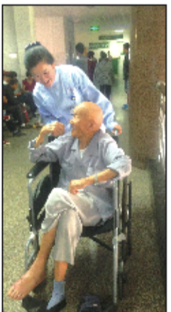
客服部工作人员正在照顾老人。

沟通,就会取得患者的理解。如果病人投诉的内容涉及医疗质量、护理质量、药品质量等,工作人员认真记录、分析,分清责任,明确责任