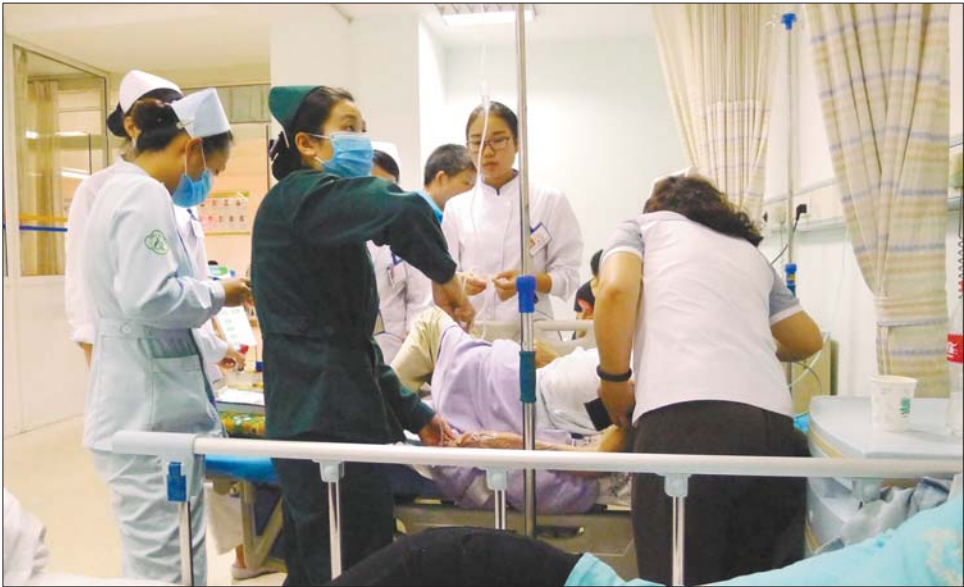
27日,中秋之夜,千佛山医院急诊室内医生和护士们正在忙碌着。虽是团圆之夜,急救人员不时送来各种情况导致的危急病人,医生护士们必须坚守。