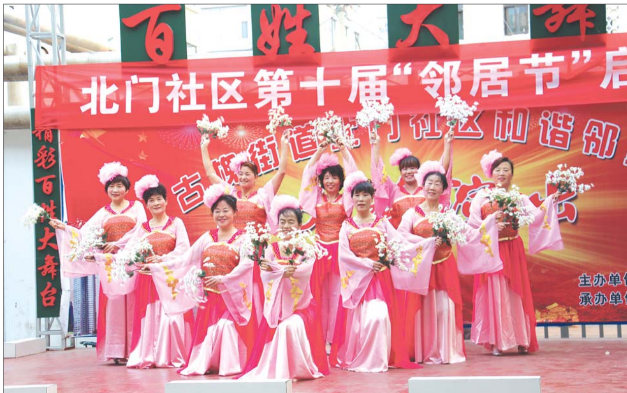
邻居节期间北门社区文艺演出。

本报济宁9月24日讯(记者 范少伟 通讯员 房地产业) 伴随着热情洋溢的舞蹈《古槐的春天》,任城区古槐街道第十届邻居节拉开序幕。趣味运动会、邻里茶话会、文艺演出……在21日到27日七天时间里,各社区精彩节目轮番上演,居民自己成了活动的主角,社区里像过年一样热闹。