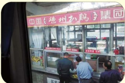
▼一进德州站,就会看到卖德州扒鸡的。