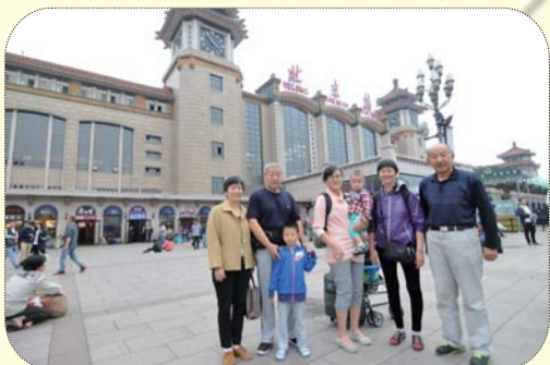
▲一家七口从滨州乘火车来到北京站后合影留念。