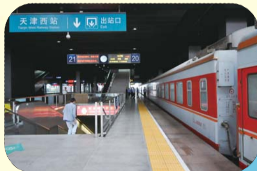
天津西站。