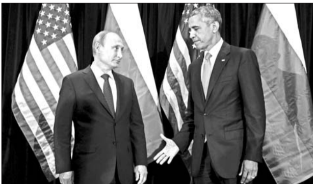
28日,美国总统奥巴马伸手欲与俄罗斯总统普京握手。