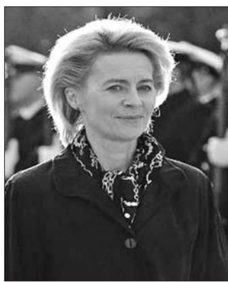
德国国防部长冯德莱恩

当年,德国政治新秀古滕贝格一度被视为总理默克尔可能的接班人,却因剽窃丑闻葬送了政治前途。如今,德国首位女性国防部长冯德莱恩被媒体猜测有意在默克尔卸任后“挑大梁”,却也传出涉嫌剽窃。剽窃传闻一旦坐实,默克尔所在联盟党很可能将再折损一员大将。