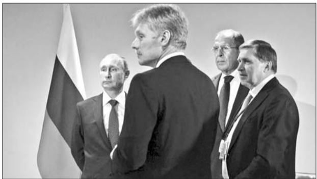
28日,由于日程原因,安倍迟到,普京与俄方官员苦等安倍。

本报讯 日本首相安倍晋三于28日下午在联合国总部与俄罗斯总统普京举行了长约40分钟的会谈。这是两国首脑自去年11月亚太经合组织领导人非正式会议期间会后,第二次举行会谈。日方有官房副长官加藤胜信、国家安全保障局长谷内正太郎等人参加会谈,俄方有外长拉夫罗夫、总统外事事务助理乌沙科夫等人出席。最后的10分钟根据安倍的提议,两位首脑在仅留翻译的情况下进行了交流。