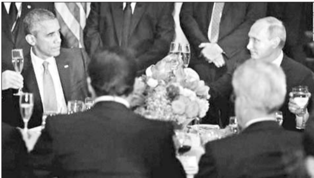
28日,美国总统奥巴马与俄罗斯总统普京在午宴上碰杯。

宣布奥巴马与普京将举行会谈的消息时,白宫称会谈提议由俄方发出,首要议题是乌克兰问题。克里姆林宫方面则表示,讨论焦点是叙利亚危机,“如果有时间”将涉及乌克兰问题。会谈结束后,一名白宫官员称,两个议题各占一半时间,先是乌克兰后是叙利亚。普京则在会谈后说,是美方首先提议举行“普奥会”。