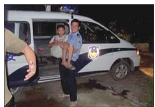
民警将孩子送回家中。

“十一”假期将至,不少市民筹划带孩子外出旅游,或者趁着假期宅在家中好好休息,但无论如何都不要忽略孩子安全,否则后悔晚矣。