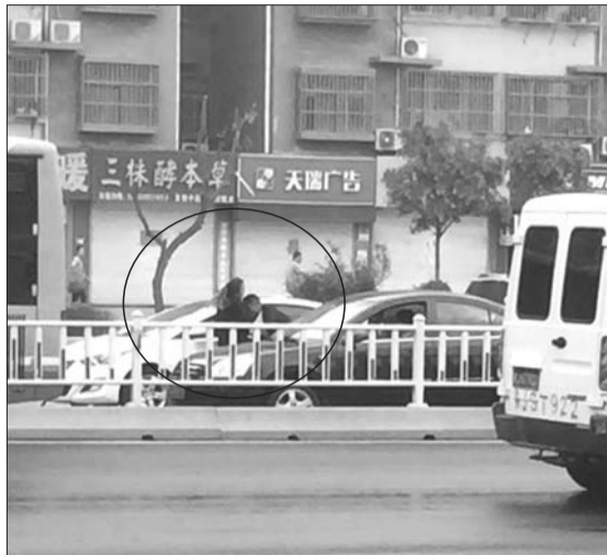
夫妻俩在路中间撕扯。

对于这对年青人的做法,泰安交警法制科工作人员表示,依据《道路交通安全法》第99条第一款第八项规定,非法拦截、扣留机动车辆,不听劝阻,造成交通严重阻塞或者较大财产损失的,由公安机关交通管理部门处二百元以上二千元以下罚款。情节严重的,可以并处十五日以下拘留。