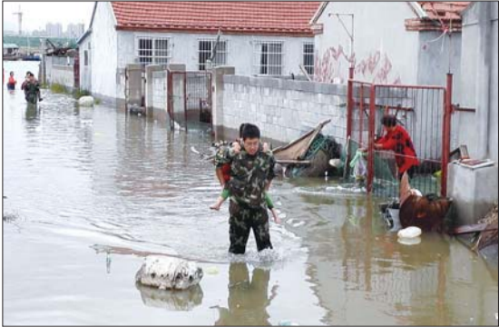
▲边防民警在救助受灾群众。 ▶原本放在50多米远桥下的渔船被掀到钓鱼台上。