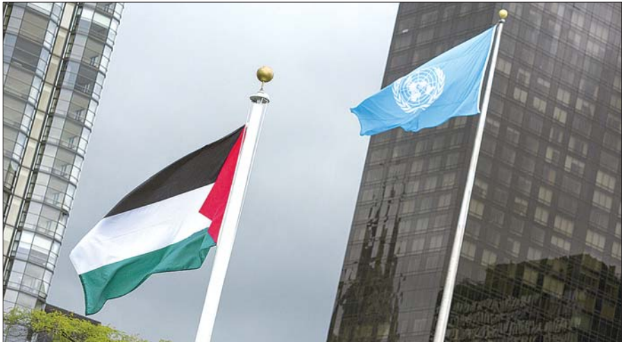
9月30日,在纽约联合国总部,巴勒斯坦国旗与联合国旗一起迎风飘扬。

2012年11月29日,联合国大会通过决议,决定把巴勒斯坦从联合国观察员实体升格为观察员国。今年9月10日,联大以