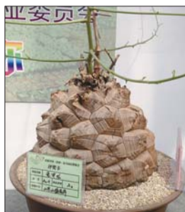
百年龟甲龙获评金奖