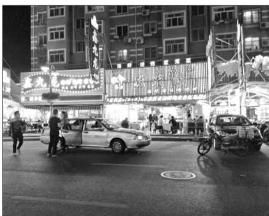
涉事餐馆正常营业,物价部门调查称其明码标价没有问题。