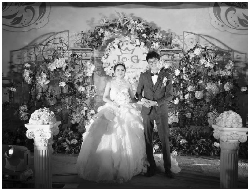
一对新人选择在“十一”期间举办婚礼。