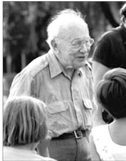
尤金·拉佐斯基青年时代(左)和年老后的照片。