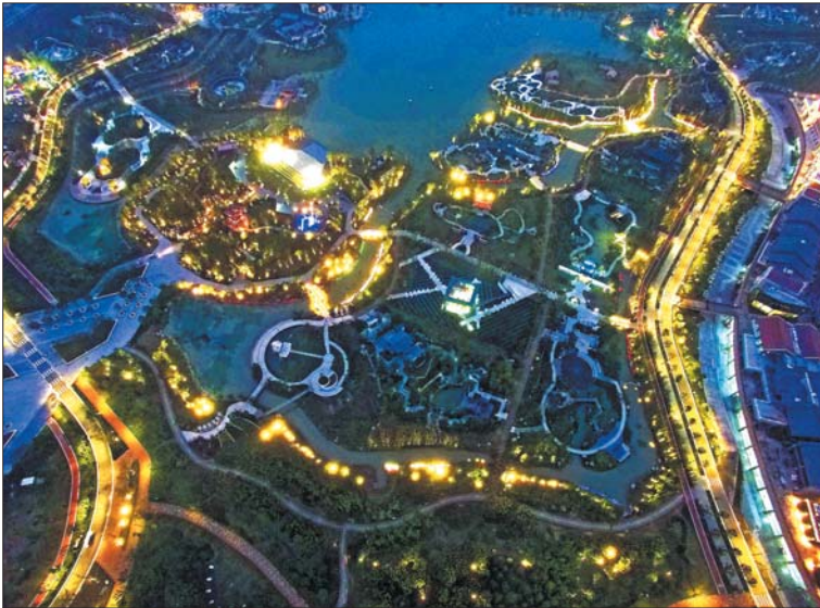
▲迷人的园博园夜景。