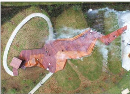
▲法国著名景观设计师杰奎琳·奥斯蒂设计的舞者的幻影。