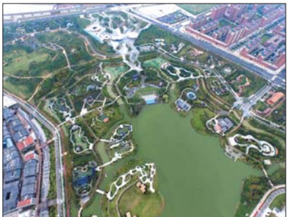
▲园博园全景,100多个不同风格的展园密布其中。