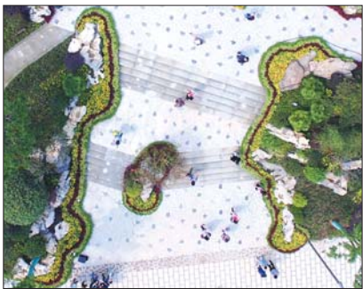
▲美丽的面对,从空中看右面这个花坛像人的侧脸。