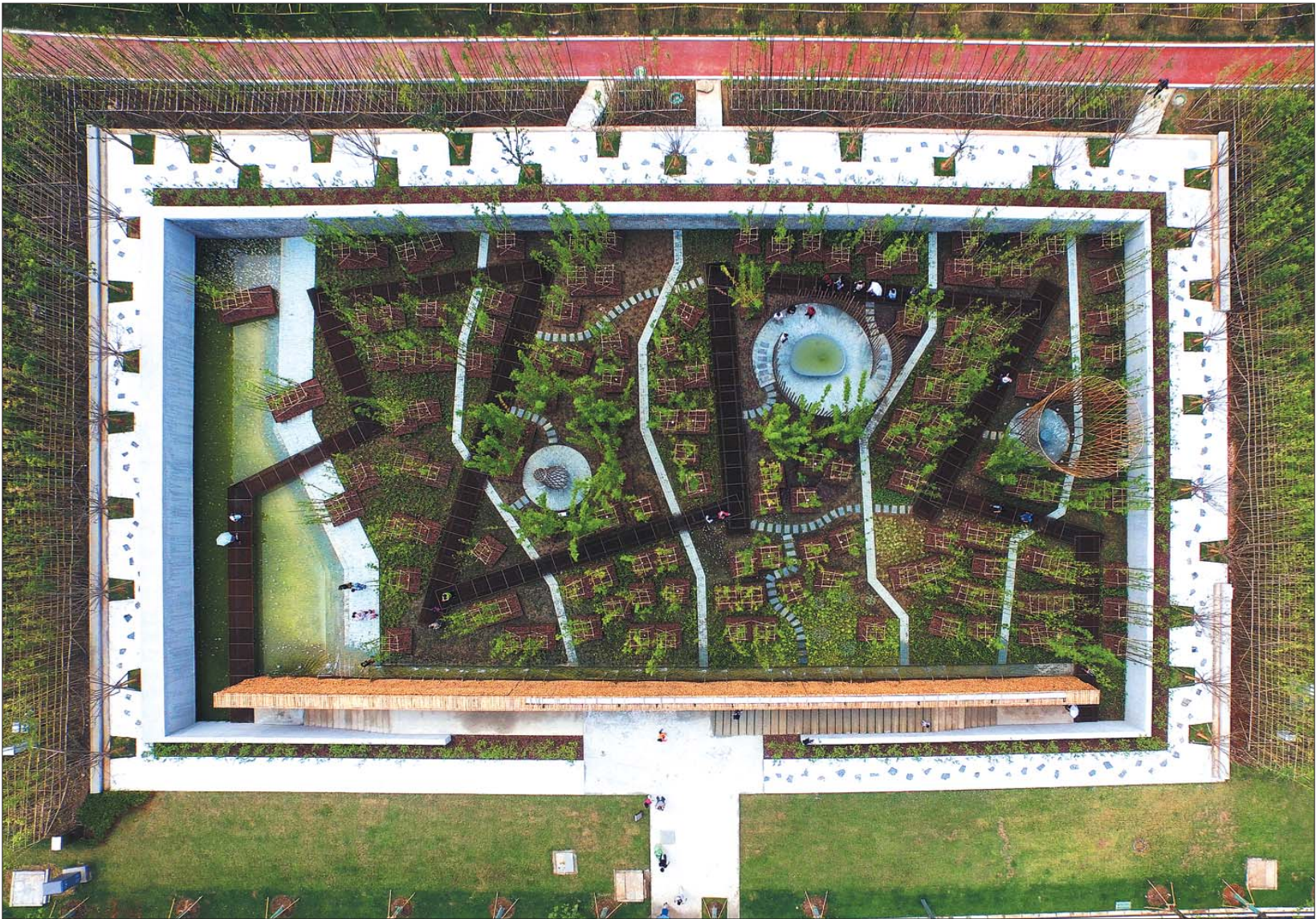
▲精致的画卷,这是法国著名风景园林大师亨利·巴瓦设计的下沉花园迷宫。