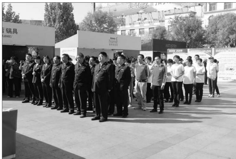
现场参加活动的工作人员和市民。