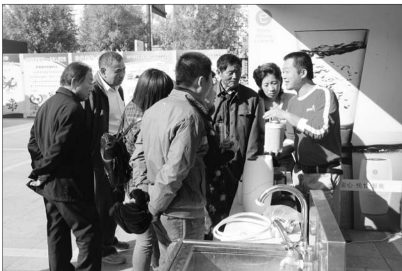
市民在活动现场了解安利产品。