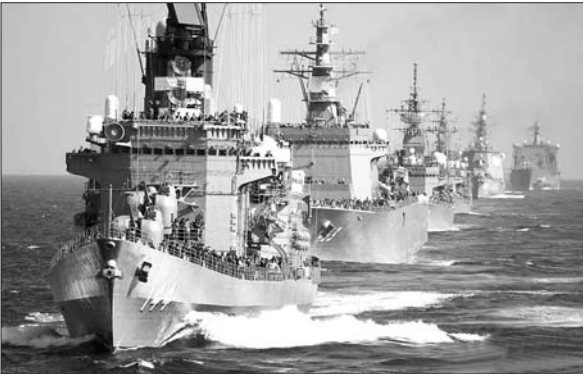
18日,日本海上自卫队在相模湾举行观舰式。

美国太平洋舰队司令斯威夫特上月曾发表讲话,对以国际日期变更线为界划定行动范围的必要性提出质疑。按惯例,国际日期变更线以西的西太平洋地区是第七舰队的行动范围,以东则是第三舰队的行动范围,后者拥有约100艘舰船,包括4艘航母。按斯威