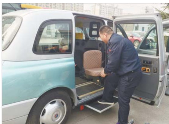
2014年,济南推出5辆针对老年人和残疾人的无障碍出租车。(资料片)