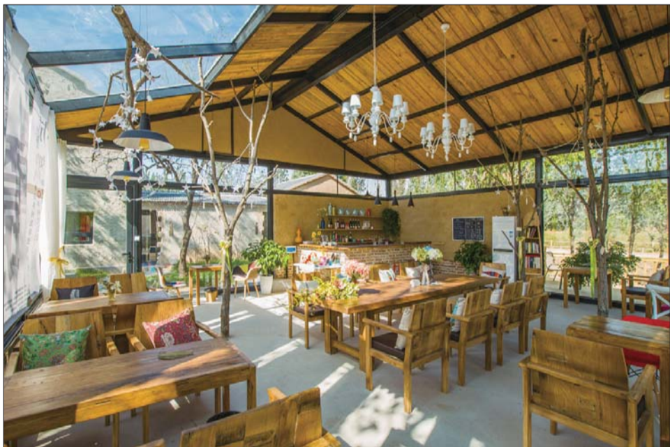
现代创意设计的农堂。

在设计中,大地乡居·香坊以小而美的建设,而非大规模的资本侵入改变乡村,示范带动性地重塑乡土价值。立足本土,将传统手工艺、地方特产、乡土材料与乡居的建筑、景观、环境、服务设施、室内装修设计相结合,创造性的展示地方风物和地域文化,并融入现代审美、休闲、消费的需要,打造成兼具设计感与乡土性的时尚乡土地假空间。从一间荒废的土坯房的变革开始,唤醒乡村中沉睡的闲置资源。