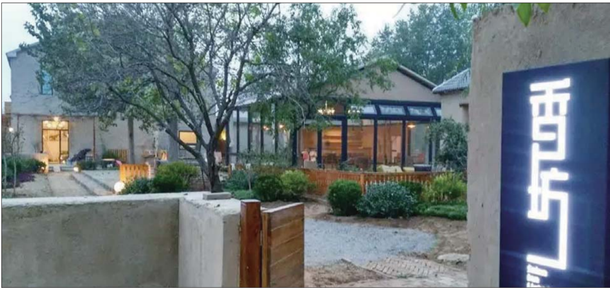
大地乡居·香坊内一步一景,处处风景。