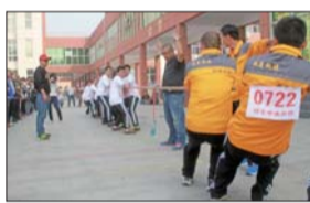
拔河比赛现场气氛热烈。

17日,“祥生中央华府杯”济北经济开发区第二届职工运动会在志远小学田径场顺利举行。据悉,本次运动会共有26支代表队,940余名干部职工参加比赛。共有26支代表队,940余名干部职工参加了比赛。