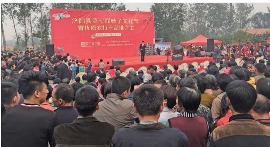
第七届柿子节开幕。

游戏吸引了众多市民亲身参与。柿子采摘现场也是热闹非凡。“以往都是自己花钱采摘,这次领了券,在祥生·中央华府售楼处盖章后就能免费摘两斤柿子,这种机会实在难得。”王女士说,该活动不仅能让市民周末放松游玩,还能让大家体会“玩着、赏着、临走还能拿着”的乐趣。目前,柿子券还在派发中,市民仍可到本报领取柿子券并前往祥生·中央华府盖章,免费乘车来采摘。