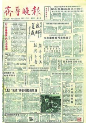
晚报创刊号(1988年1月1日)