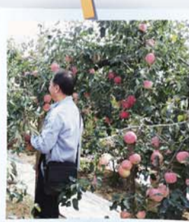
看房团参加香水海果园采摘活动