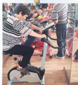
看房团在卓达业主之家体验