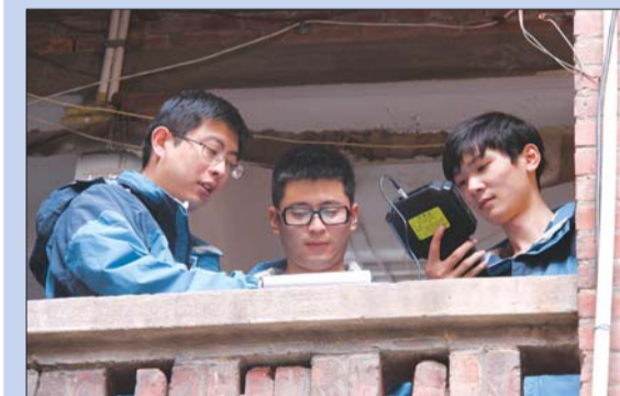
为老旧危楼“查体”,保障住房安全。