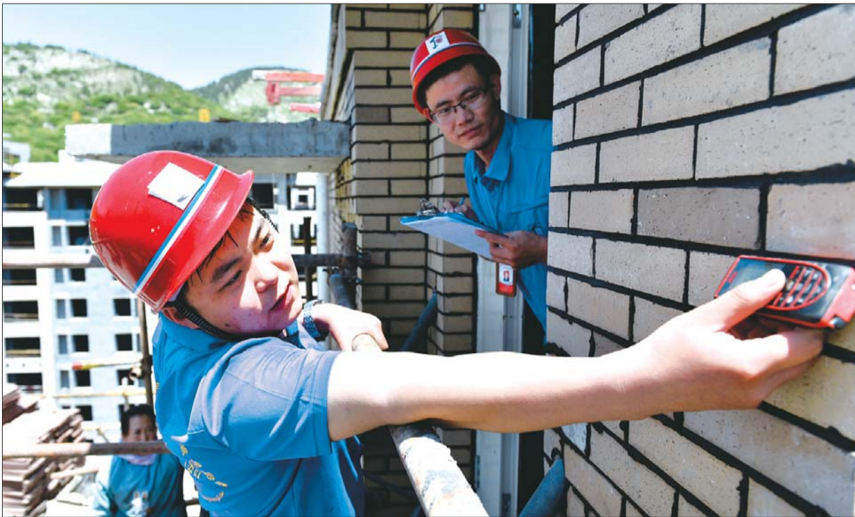
突击队员悬空测量,确保测绘数据准确全面。

“房屋安全无小事,鉴定任务就是命令。”这是他们共同的工作信条。不管鉴定的是几十平方米的小民居,还是上万平方米的大厂房,他们都用精确的数据给委托人提供可靠的鉴定结论,为济南的房屋使用安全做出贡献。