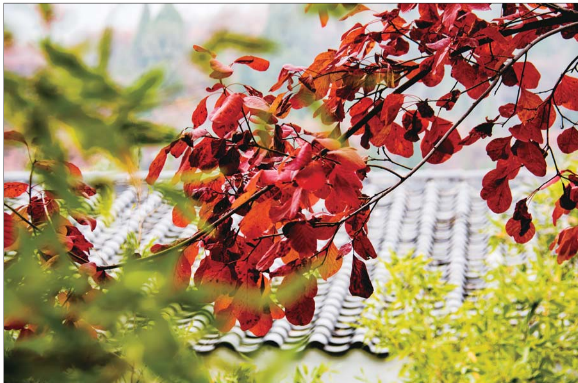
争奇斗艳。