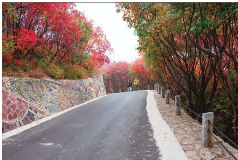
浪漫邂逅。