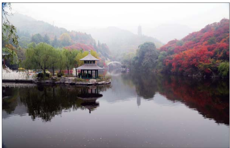
朦胧仙境。