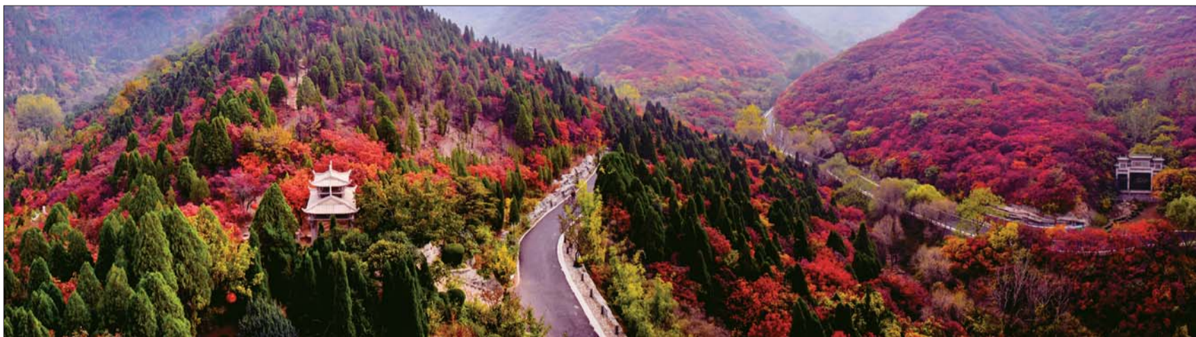
层林尽染红叶谷。