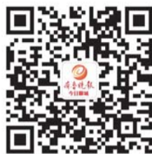
齐鲁晚报·今日聊城 微信公众平台

童谣展演活动报名方式: 1、邮箱:guyunlc@126.com,表注明名字、年龄、联系方式。 2、通过齐鲁晚报·今日聊城微信公众平台直接报名。