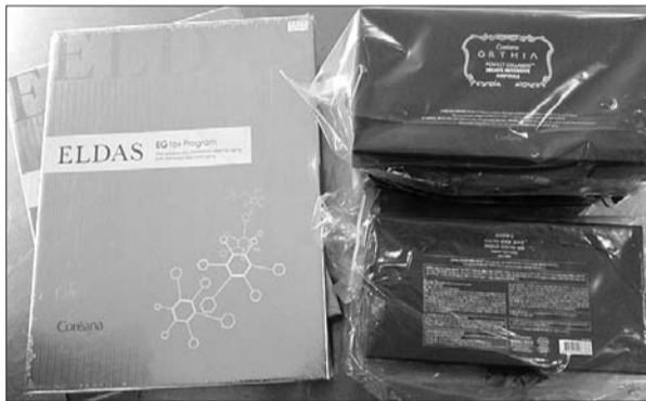
检验检疫部门工作人员查获的肉毒素。

检验检疫部门提醒,出国旅游购物前了解相关法律法规,以免入境时携带禁止携带入境物品被扣留或罚款而造成不必要的财产损失。