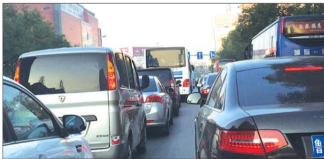
东岳大街也堵。