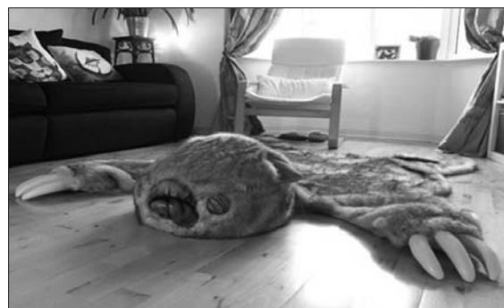
抱着爱宠看电视玩游戏,确实暖暖的。