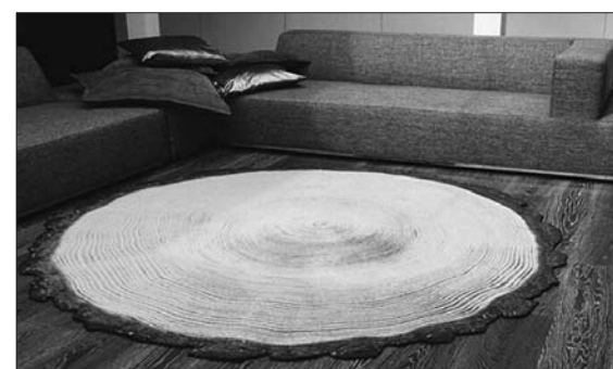
简约的家装风格,搭配天然的地毯图案,心向往矣。