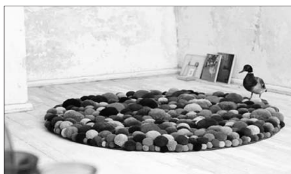
看着这些彩色团团就想躺下。