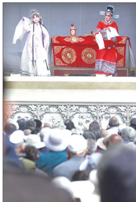
古城内的曲艺表演。

根据活动安排,曲艺文化艺术周期间,将举办“谁不说咱家乡好”曲艺新作大赛,尤为引人注意的是,11月7日,“谁不说咱家乡好”曲艺新作大赛初赛、优秀传统节目展演,将在中华水上古城楼北戏台举行。