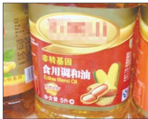
一款调和油包装上明显标注了“非转基因”。

来。据了解,不少知名食用油品牌先后推出了主打非转基因的食用油产品,目前除了花生油没有转基因的之外,其他种类的食用油非转基因占了大多数。