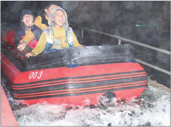
二等奖 作者 殷艳丽 奖励价值300元奖品