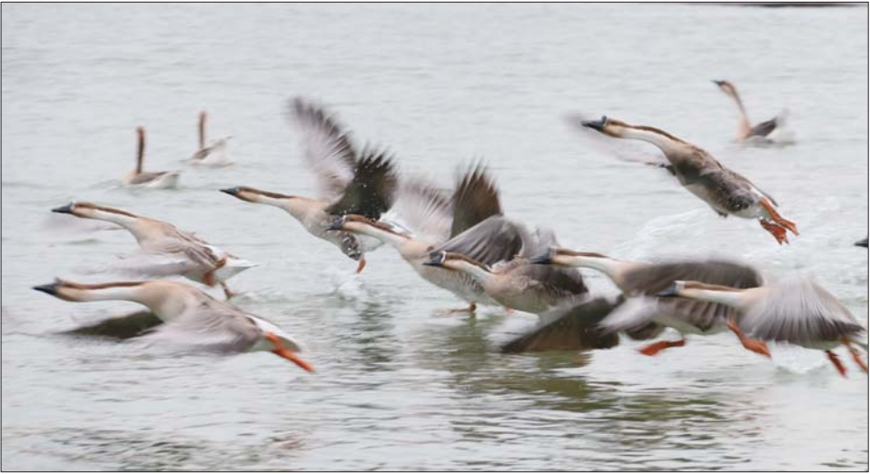
一等奖 作者 龚晓民 奖励价值500元奖品

有点手忙脚乱,在随队老师的指导下马上就应对自如了,这种实践课对摄影水平提升太快了。 本报拍课堂第六期已经开课,报名火热进行中,咨询电话0531-88558458。