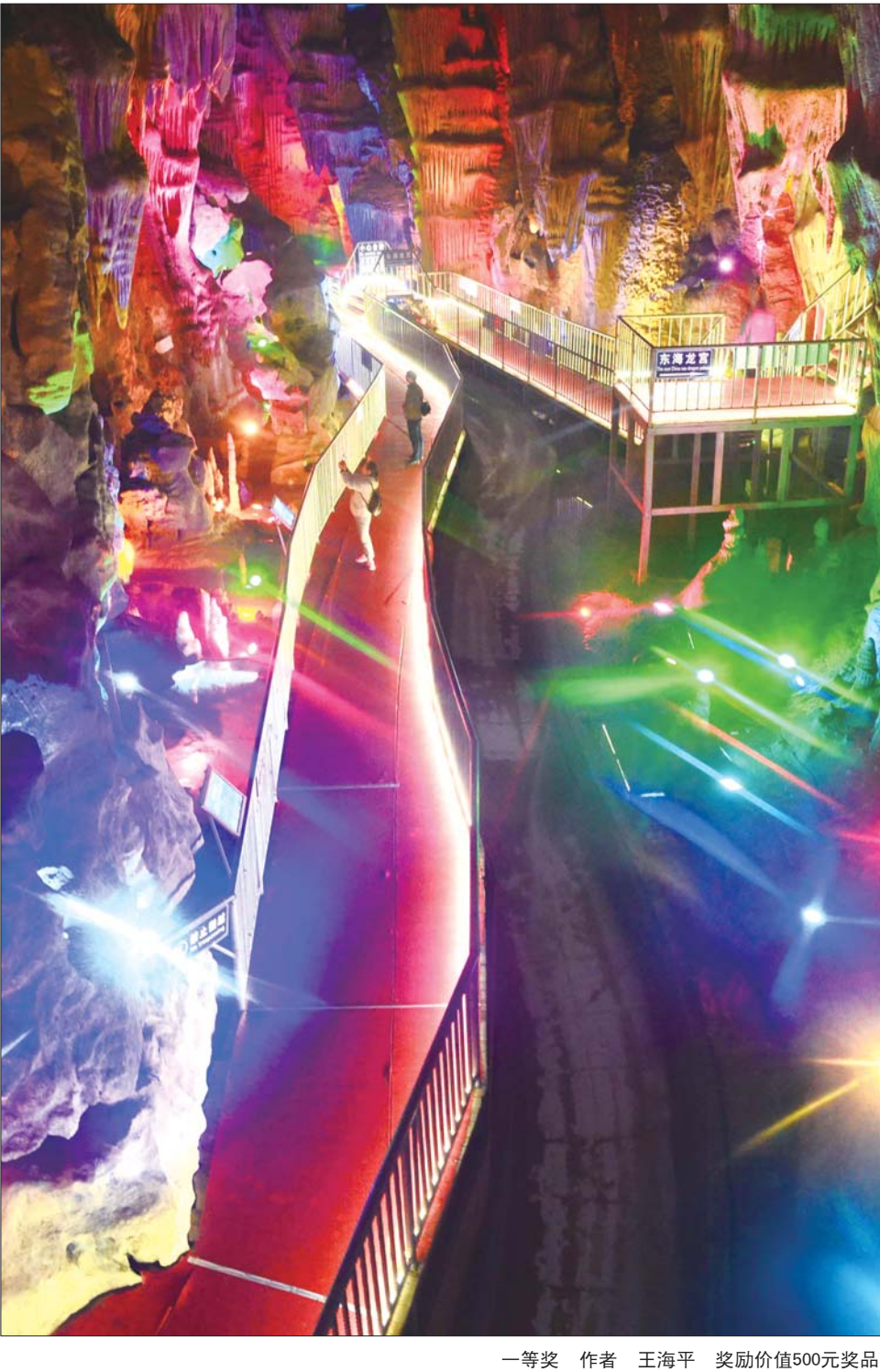
一等奖 作者 王海平 奖励价值500元奖品