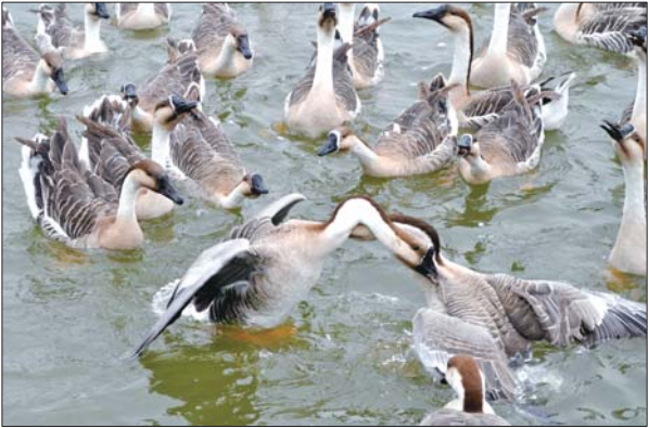
三等奖 作者 张芳 奖励价值150元奖品