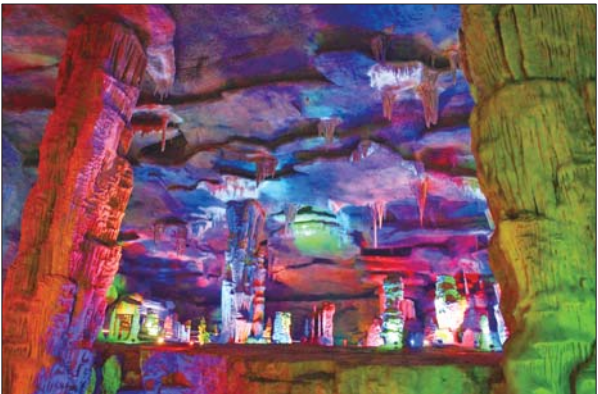
三等奖 作者 刘明媛 奖励价值150元奖品